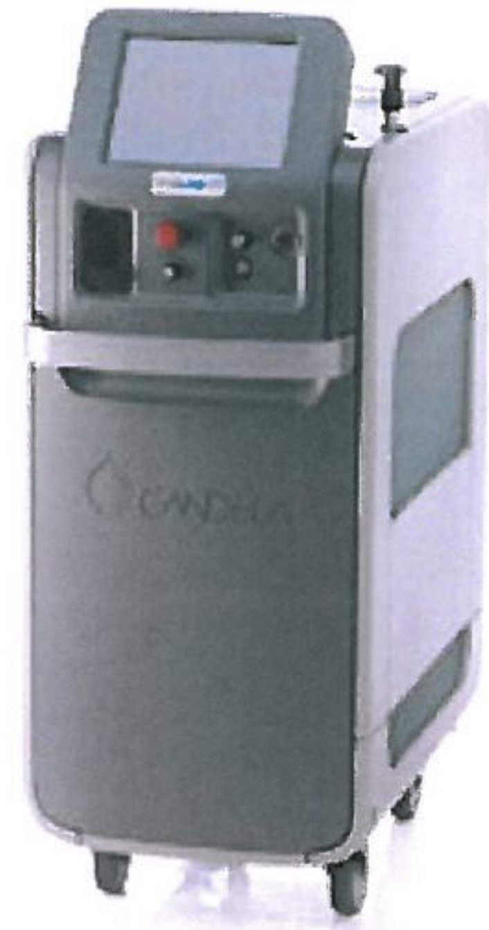
Figure 1 : System Console