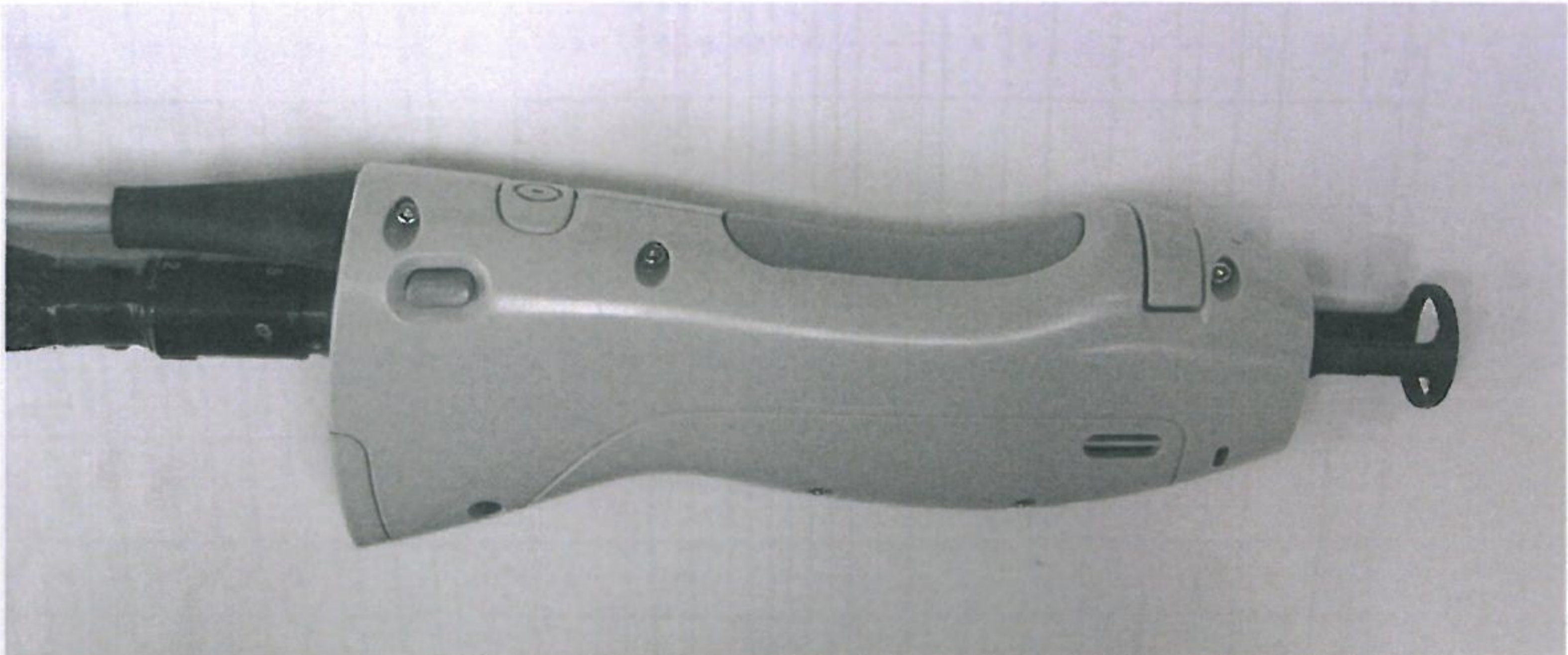
Figure 2 : DCD Delivery System